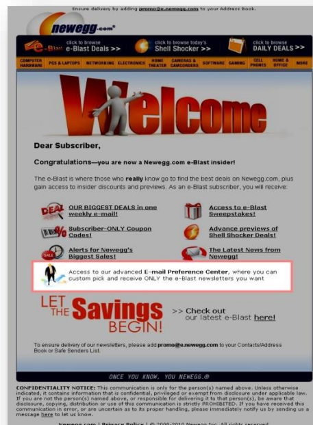
Beispiel für eine Begrüßungs-Email

in die HTML-Email übernommen werden. Die Email wird danach personalisiert versendet.