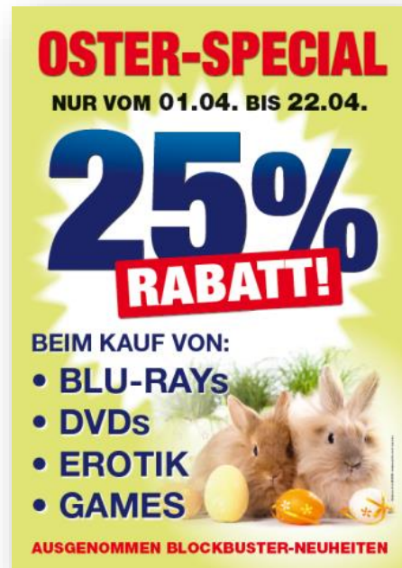
Beispiel für eine Oster-Aktion